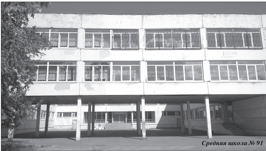
Средняя школа № 91