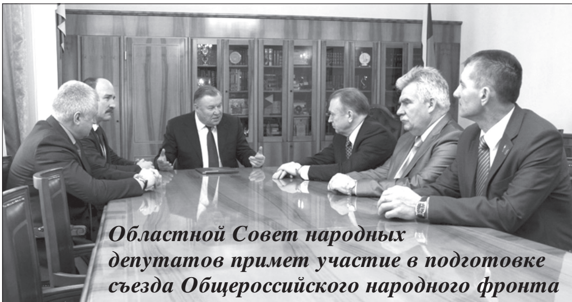
Областной Совет народных депутатов примет участие в подготовке съезда Общероссийского народного фронта

«У нас получилась очень интересная дискуссия, был вне-