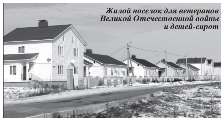
Жилой поселок для ветеранов Великой Отечественной войны и детей-сирот

Все ФАПы в поселениях были приведены в соответствие с утвержденными нормами, что дало возможность каждому из них получить лицензию. Не менее серьезная работа потребовалась для создания на базе ГУЗ «Усманская ЦРБ» межмуниципального сердечно-сосудистого центра, открытие которого состоится в ближайшее время. Этот центр оснащен всем необходимым оборудованием для выявления и оперативного лечения кардио-со-