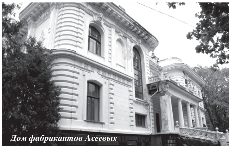
Дом фабрикантов Асеевых

Илья ГРЕКОВ, корреспондент «ЭЖ-Черноземье»