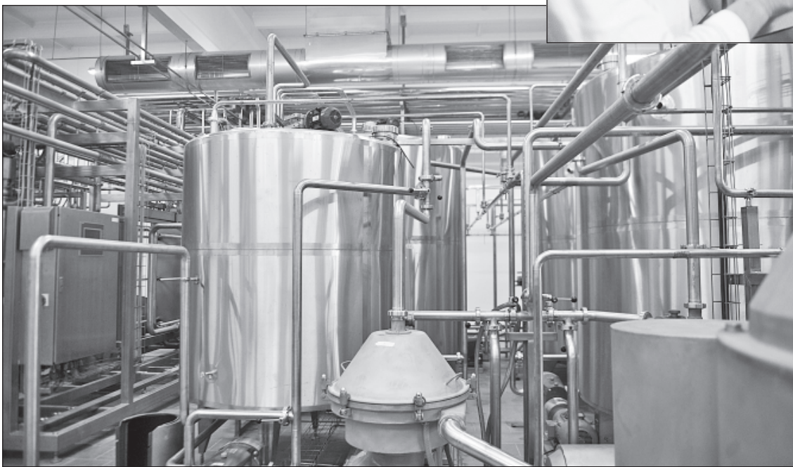
Филиал ОАО МКВ «Калачеевский сырзавод» (Молвест)