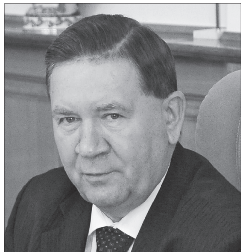
Лучший губернатор Черноземья – Александр МИХАЙЛОВ, губернатор Курской области