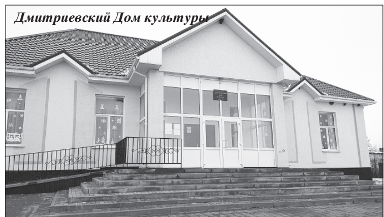
Дмитриевский Дом культуры