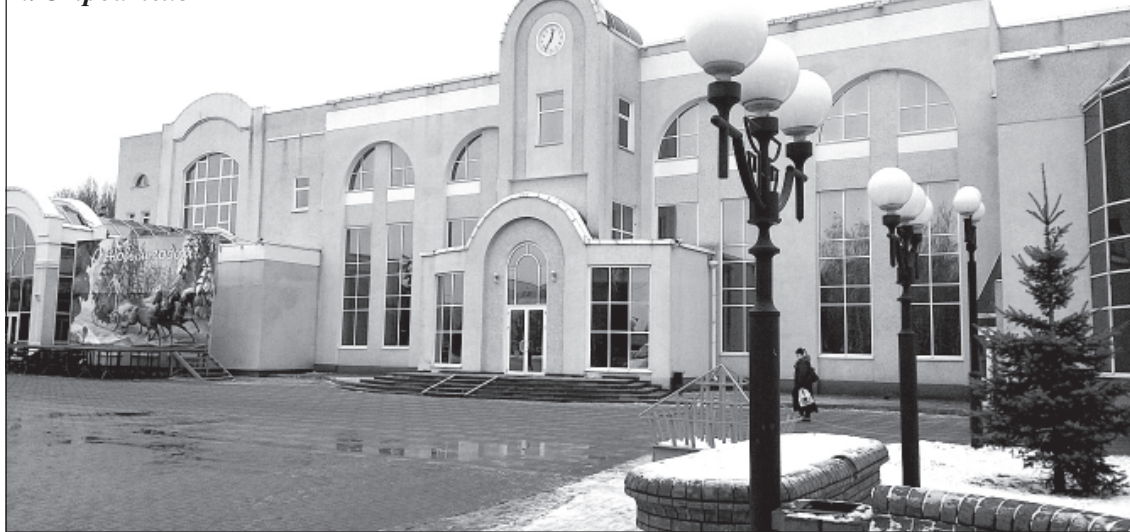
Дом культуры в районном центре, п. Строитель