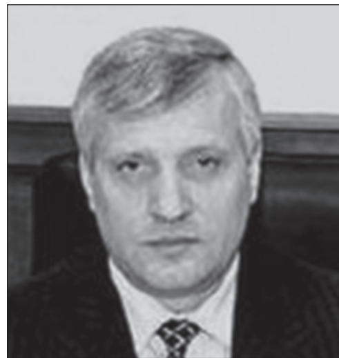
Лучший федеральный чиновник на территории Центрального Черноземья – Александр СОЛОВОВ, главный федеральный инспектор аппарата полпреда Президента в ЦФО по Воронежской области