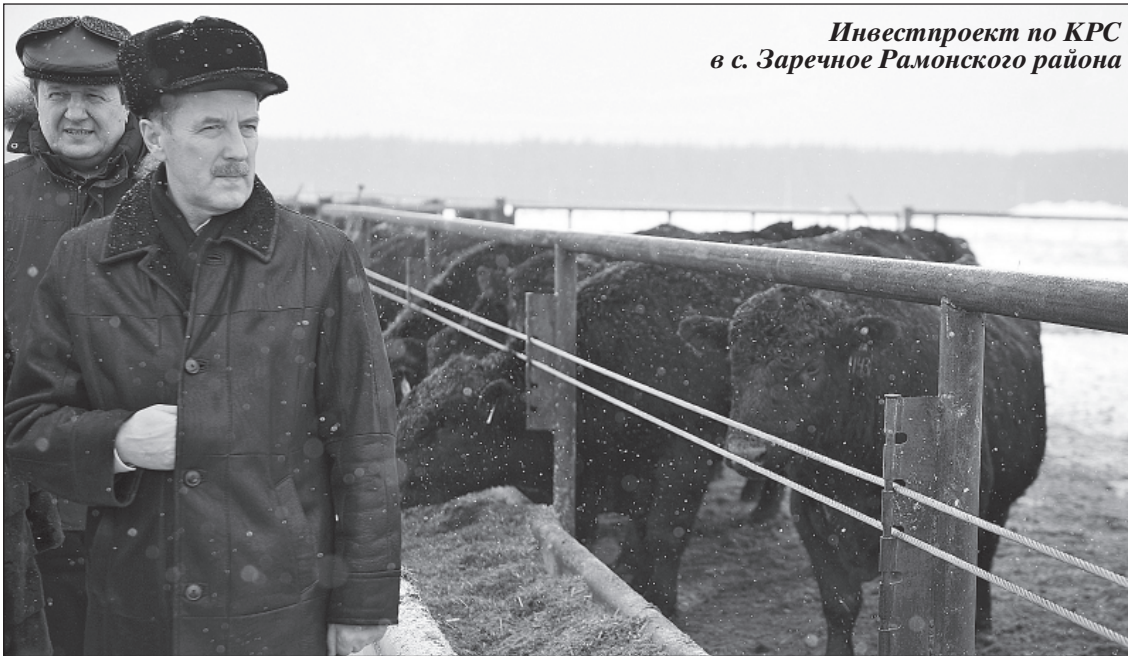
Инвестпроект по КРС в с. Заречное Рамонского района

ции и, прежде всего, в торговые сети, подписывать с ними соглашения о приоритете поставок именно воронежской продукции.