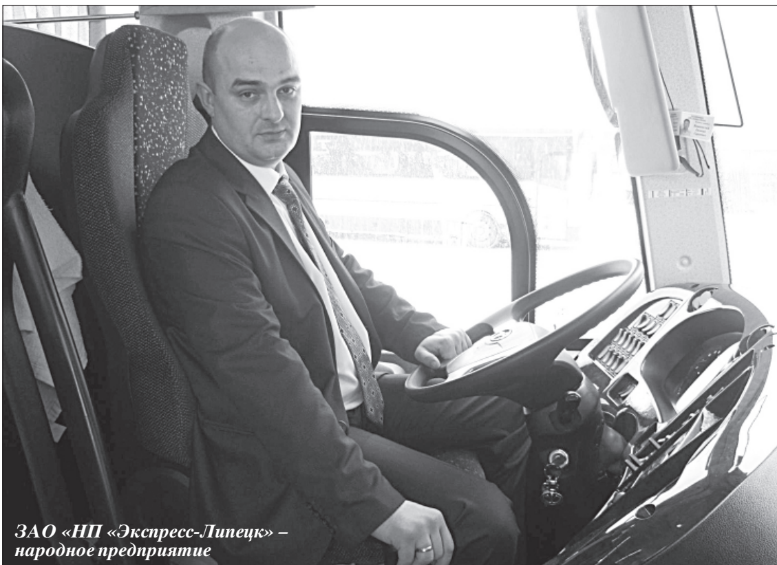
ЗАО «НП «Экспресс-Липецк» — народное предприятие

Роман ТРУБНИКОВ, обозреватель «ЭЖ-Черноземье»