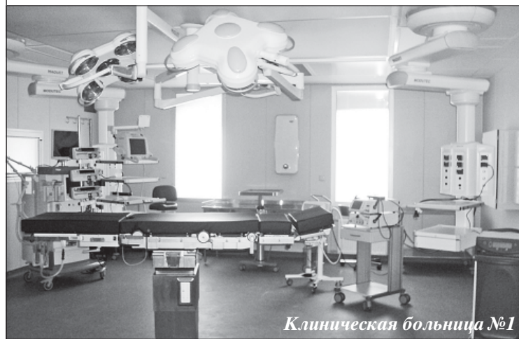
Клиническая больница №1

В прошлом году был проведен капитальный ремонт в урологическом, травматологическом и кардиологическом отделениях Городской клинической больницы скорой медицинской помощи № 1, оснащен оборудованием и открыт областной перинатальный центр, включающий стационар на 130 коек и поликлинику на 100 посещений в смену, проведена реконструкция кардиохирургической реанимации, трех операционных залов и центрального стерилизационного отделения первого корпуса в Воронежской областной клинической больнице № 1, завершено строительство инфекционного корпуса на 150 коек областной детской клинической больницы № 2, проведены ремонтные работы в больнице «Электроника».