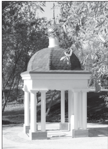
Туристов привлекают в Прохоровский район живописные уголки природы

Относительно состояния культурной сферы следует отметить, что на территории района действуют 23 сельских дома культуры и 9 сельских клубов, районный дворец культуры на 600 мест, районная, детская и 28 сельских библиотек, районный организационно-методический центр, Дом ремесел, детская школа искусств с двумя филиалами, агитбригада, парк культуры и отдыха. В этом году мы планируем завершить капитальный ремонт всех учреждений культуры района.