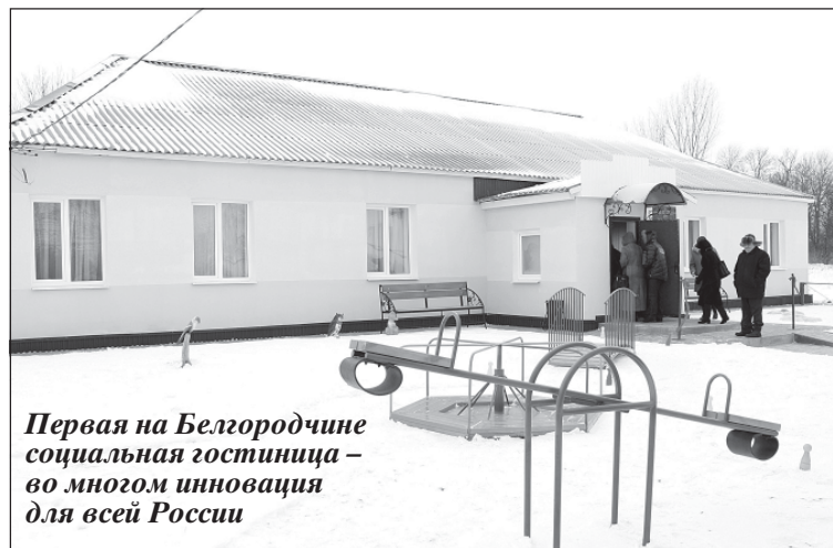
Первая на Белгородчине социальная гостиница — во многом инновация для всей России