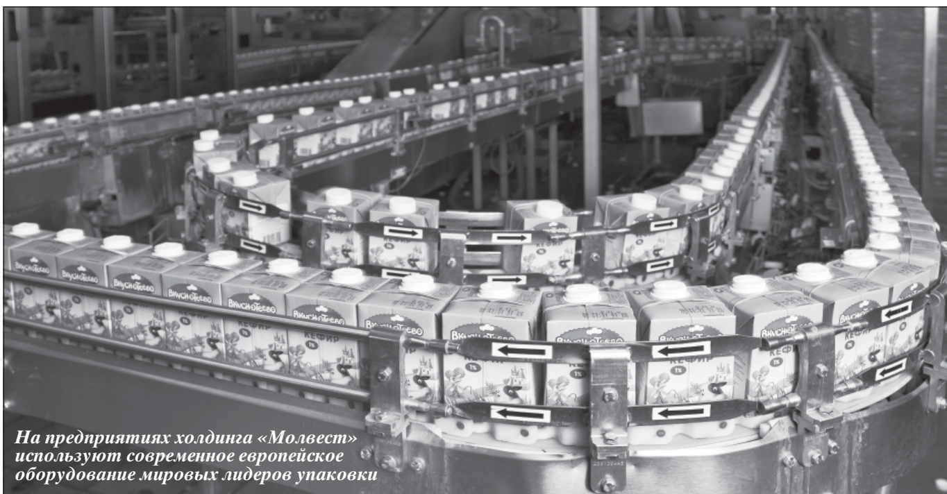
На предприятиях холдинга «Молвест» используют современное европейское оборудование мировых лидеров упаковки

В настоящее время холдинг «МОЛВЕСТ» поставляет свою продукцию в 33 региона России и 6 областей Украины.