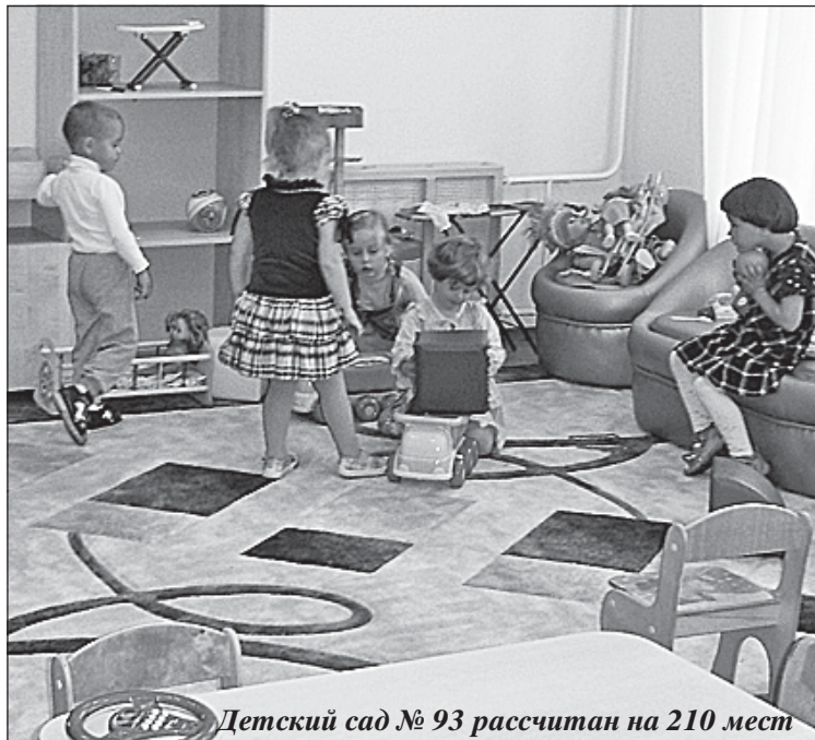
Детский сад № 93 рассчитан на 210 мест

Тандем законодательной и исполнительной власти Воронежа работает в интересах развития мегаполиса