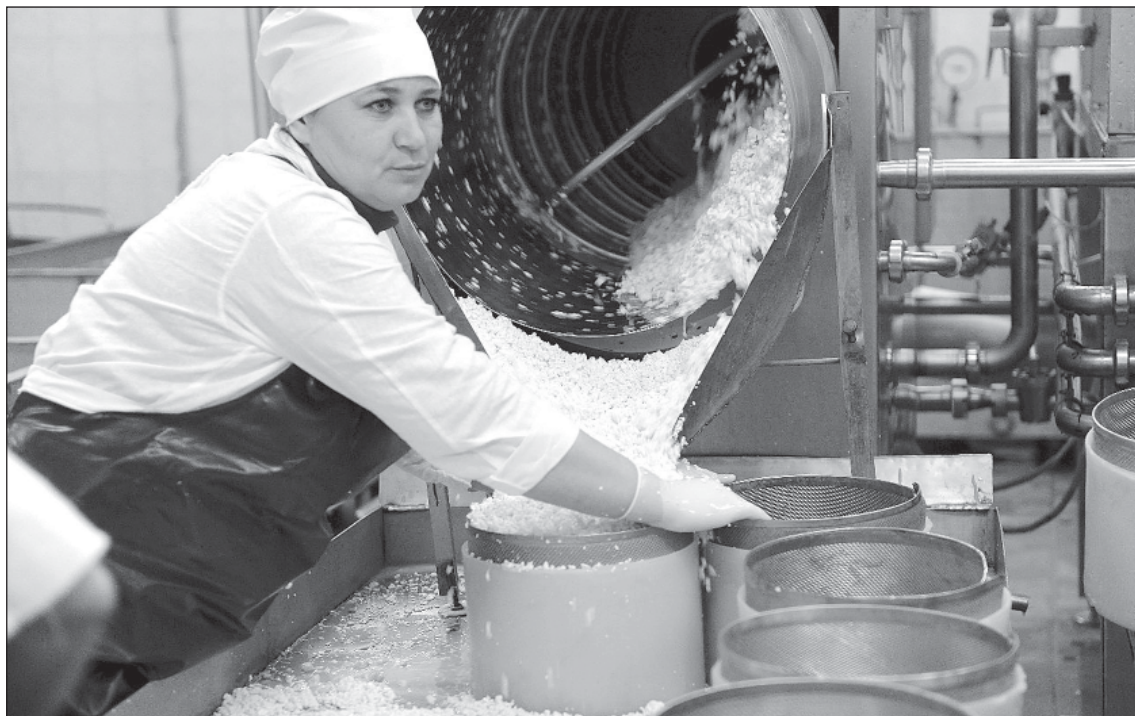
Каждый сотрудник компании – профессионал своего дела

– Если Сбербанк захочет, то будет в нем участвовать. Со Сбербанком у нас нормальные, давно сложившиеся отношения, не раз проверенные кризисом. Это единственный банк, с которым мы всегда находим взаимопонимание как в текущей работе, так и в проектах на перспективу. Всегда находятся схемы, которые приемлемы для всех и никак не тормозят развитие, помогают реализовывать масштабные начинания.