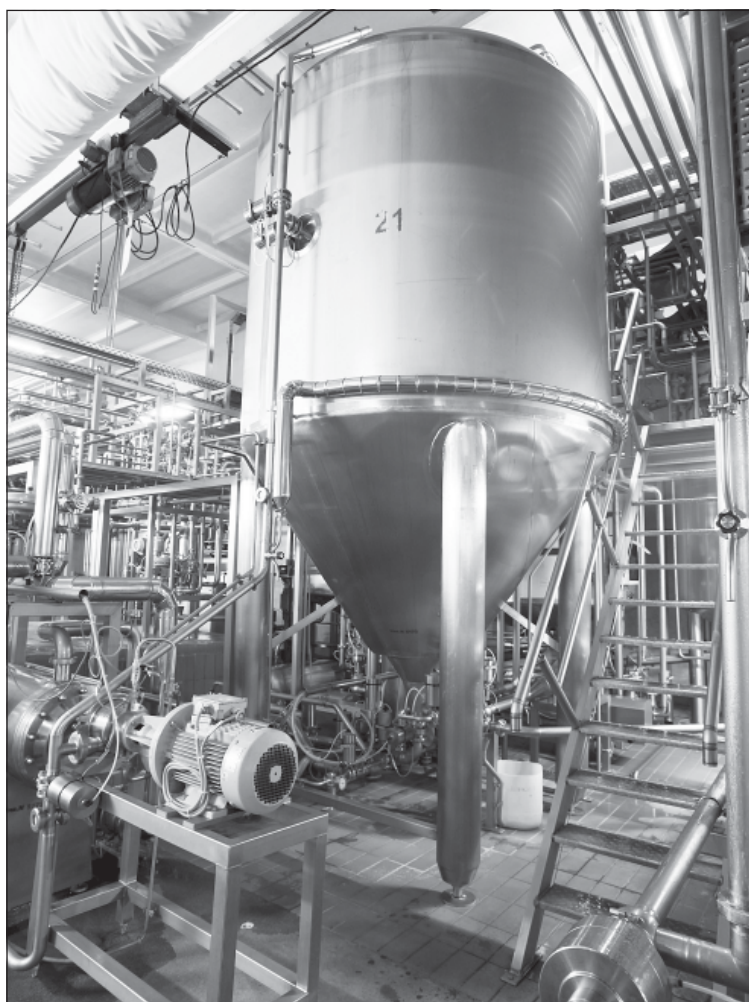
Процесс переработки молока и производства молочных продуктов на предприятиях холдинга «Молвест» полностью автоматизирован

Важным фактором стал собственник: его способность организовать команду, его амбиции, его желание, рассчитать или интуитивно определить бизнес-стратегию.