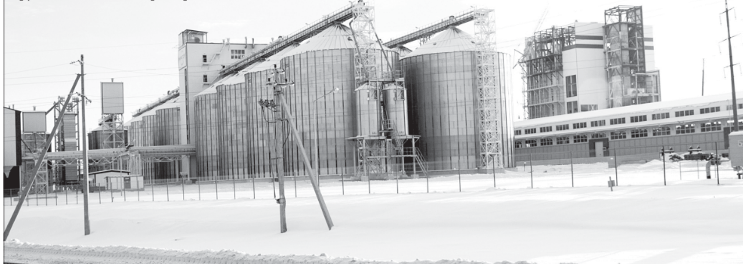
Комбикормовый завод Группы компаний «Мираторг»

Добиваться устойчивых темпов развития экономики района помогает повышение конкурентоспособности выпускаемой продукции, улучшение инвести-