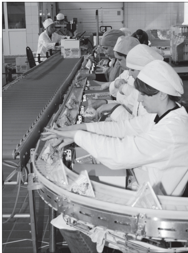
Более 1000 школ регулярно получают молоко в пирамидках компании «Молвест» в рамках национальной программы «Школьное молоко»

— Мы всегда делали все за счет собственных усилий и те предприятия, которые приобретали, покупали целиком. И, как правило, это были банкротные предприятия. Разумеется, помимо масштабных инвестиций в реконструкцию, они требовали восстановления деятельности практически с нуля, начиная от поставок сырья и заканчивая продажами и системой сбыта, формирования команды, отла-