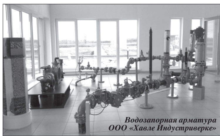
Водозапорная арматура ООО «Хавле Индустриверке»

Ожидание инвесторов было недолгим. Уже в июле 2007 года зарегистрировалось и начало строительство завода ООО «Хавле Индустриверке», дочернее общество мирового лидера по производству водозапорной арматуры из Швейцарии. Затем появились две немецких компа-