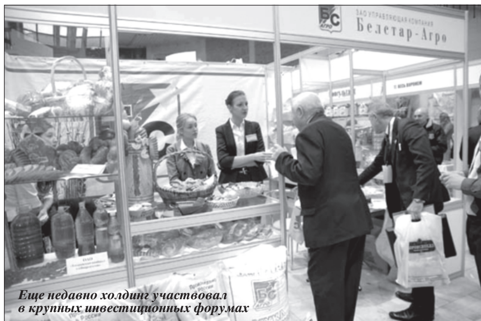
Еще недавно холдинг участвовал в крупных инвестиционных форумах