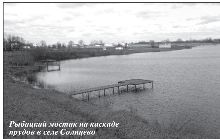
Рыбацкий мостик на каскаде прудов в селе Солнцево

Третьим сегментом, который в определенной степени также можно считать условием сохранения сельского уклада в черноземном регионе, в Чаплыгинском районе стало развитие сельского туризма. Примечательно, что именно этому молодому, в силу чего и весьма перспективному туристическому направлению отводится столь значимое внимание в районе с богатейшим культурно-историческим наследием. В районе, райцентр которого построен по эскизному плану пятибашенной крепости самого Петра Первого в начале восемнадцатого века. Кто-то предположит, что интерес именно к сельскому туризму вызван мировой тенденцией и стремлением туристов в обычную сельскую глубину. Возможно, так оно и есть. Но, как бы то ни было, отнюдь не руководством района эта тенденция была вовремя осмыслена, и уже сейчас живописная природа чаплыгинской земли становится излюбленным местом отдыха для гостей из столицы, которые с удовольствием меняют динамичный темп мегаполиса на размеренное течение времени в первозданном уголке