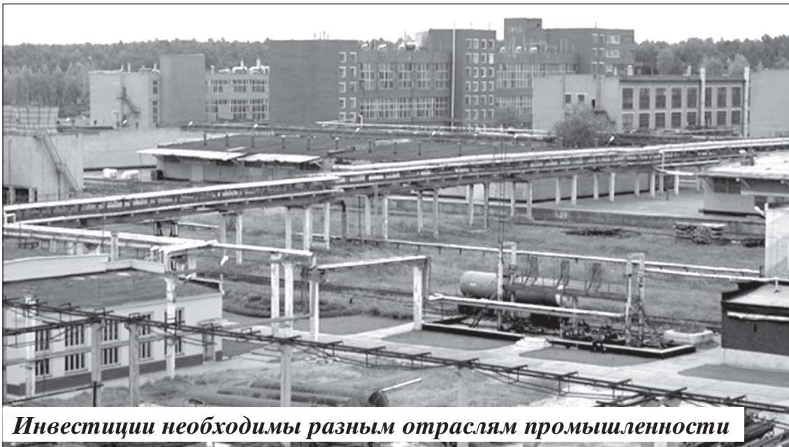
Инвестиции необходимы разным отраслям промышленности

В рамках коллегии директоров ОАО «Концерн «Созвездие» обсуждался вопрос о формировании на базе ОАО «Тамбовский завод «Октябрь» инвестиционной площадки по аналогии с созданной в 2010 году на базе ОАО «Пигмент» инвестиционной площадкой «Индустриальный парк «Тамбов». Создание нового индустриального парка позволит предприятию не только задействовать свободные производственные площади, но и уменьшить налоговое бремя в части снижения ставки налога на землю, что, в свою очередь, благоприятно отразится на финансовом состоянии завода.